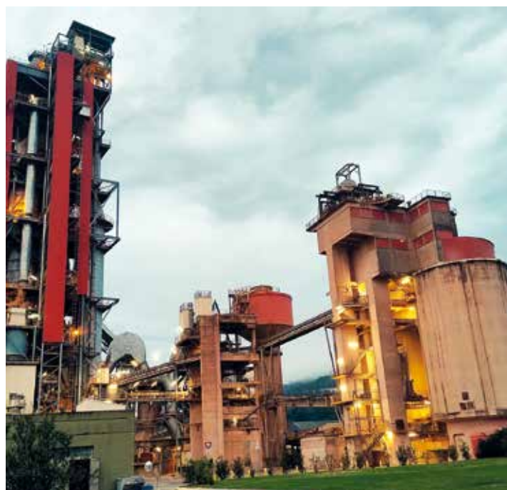
Entreprise Lafarge à Martres-Tolosane

Un moment à ne pas manquer pour poursuivre cette dynamique d'échanges et de collaborations. Pour plus d'informations sur les rencontres entreprises : dev.eco@cc-coeurdegaronne.fr