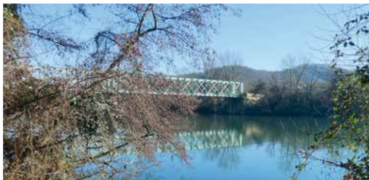
Pont suspendu de 1844 construit par l'architecte Marnac

Toute l'équipe municipale œuvre à la qualité de vie des habitants de Boussens. Cela fait bientôt 42 ans que j'assume un mandat électoral pour cette commune qui me passionne. Mais il est temps de penser à ma famille, c'est pourquoi je termine ce mandat avec la réalisation de deux magnifiques projets : la construction de la halle (photo ci-contre) et la stèle commémorant l'époque de l'industrie gazière et pétrolière qui devrait voir le jour en 2025, en collaboration avec les élèves du lycée professionnel de Gourdan-Polignan."