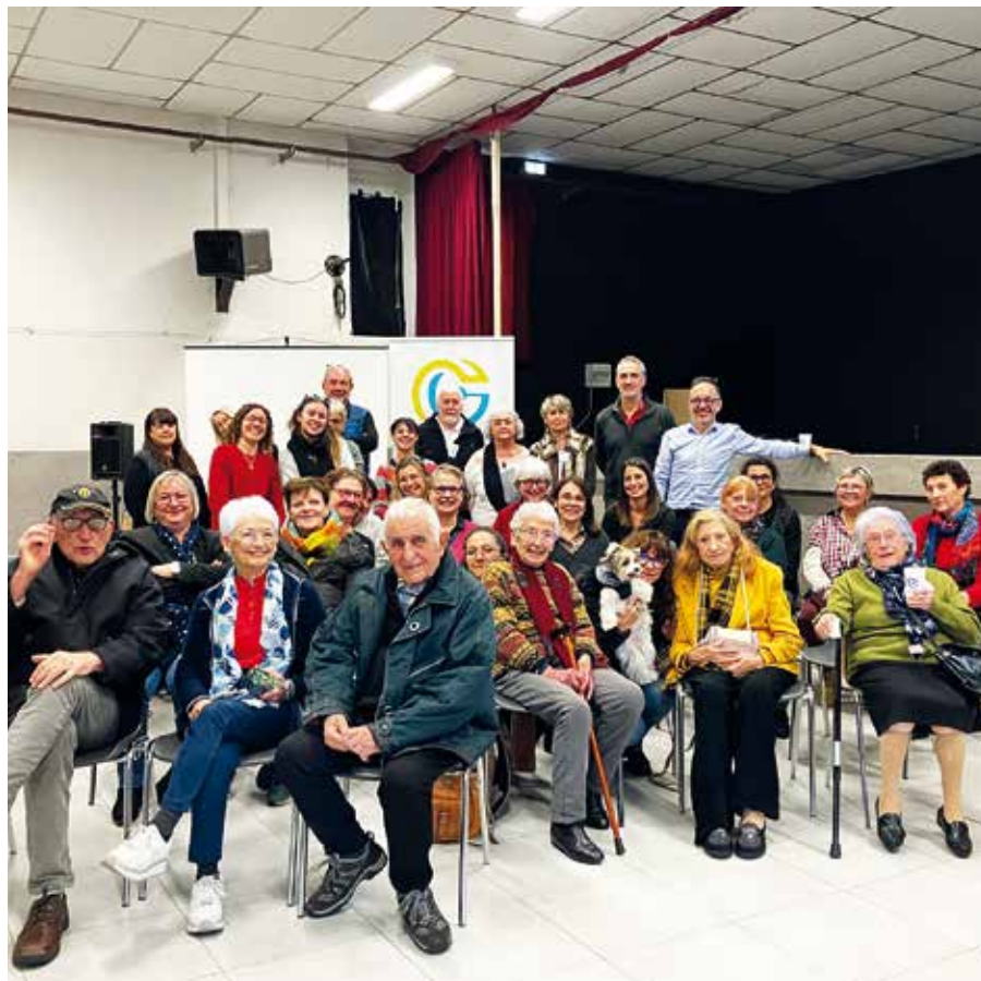
Un moment convivial à Saint-Elix-le-Château

La projection de photos autour d'un pot de l'amitié a été l'occasion de partager de beaux souvenirs des moments passés ensemble au cours de ces dernières semaines.