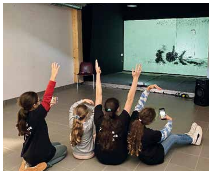
Atelier focale Z / Cie KDance

Cette découverte se poursuivra du 24 au 28 février 2025 (vacances d'hiver) avec une semaine d'ateliers autour du mouvement, de l'image et du son. Inscription auprès des espaces jeunes (à Lherm, Rieumes, Bérat, Le Fousseret, Cazères et Martres-Tolosane).