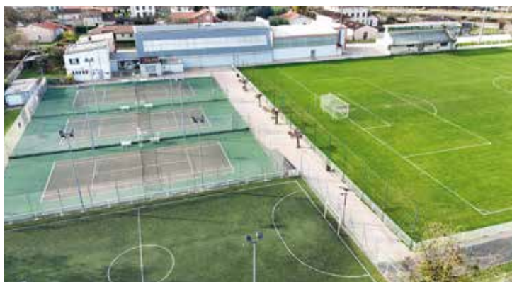
Les équipements sportifs