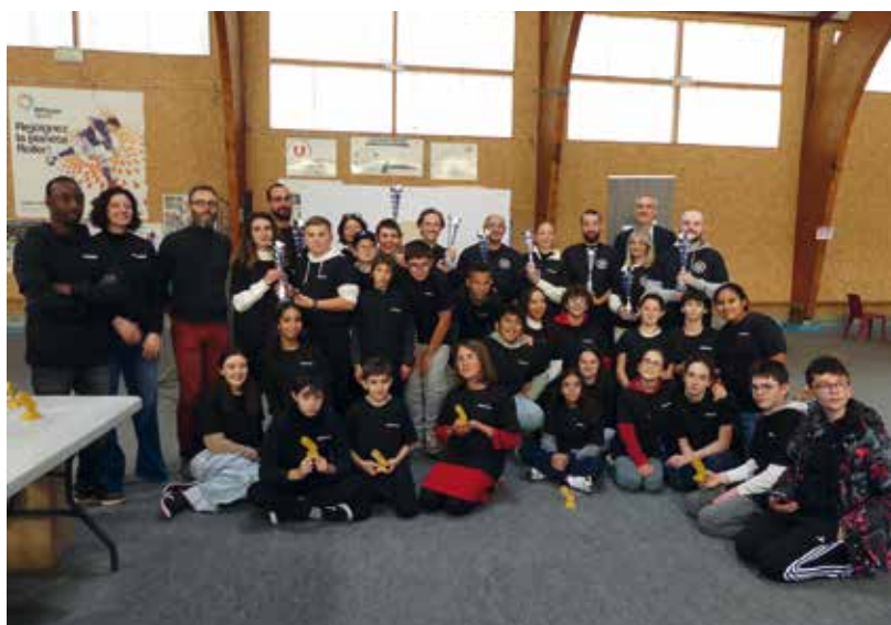
L'équipe des animateurs et des bénévoles

Rendez-vous en 2026 pour la 3ème édition du trophée numérique Coeur de Garonne !