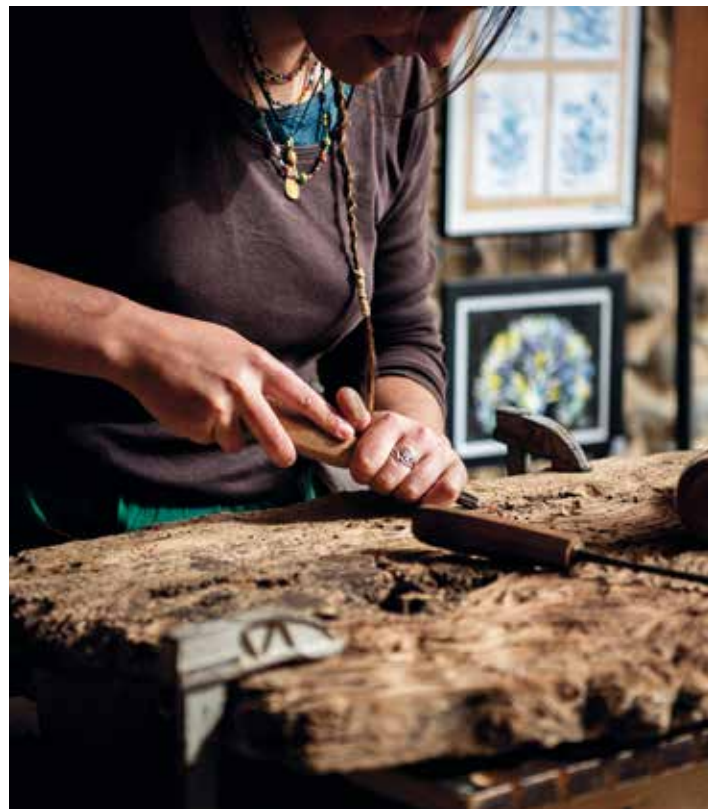
Journées européennes des métiers d'art