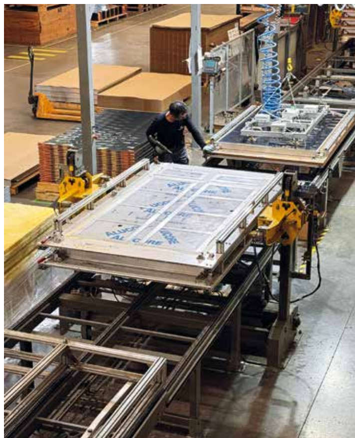
Entreprise HélioFrance à Bérat